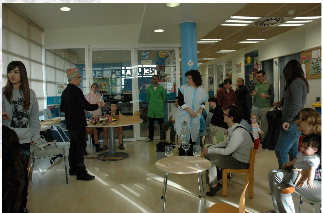
Aula hospitalària de l'Hospital Universitari Arnau de Vilanova.

El Museu Hospitalari porta a terme tallers educatius adaptats a les necessitats educatives de les aules hospitalàries i compta amb la supervisió dels responsables de les mateixes. Són activitats que es realitzen, segons els casos, amb la participació dels pares o dels professionals del centre hospitalari.